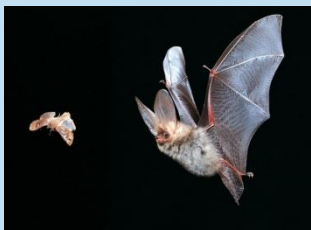
Oreillard chassant un papillon de nuit