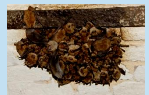
Colonie de vespertillons

L'hiver, les chauves-souris ne trouvant plus de quoi se nourrir, elles vont rentrer en léthargie. Pour cela, elles recherchent des milieux à température et humidité constantes tels les grottes, les anciennes carrières, les ouvrages militaires désaffectés, etc.