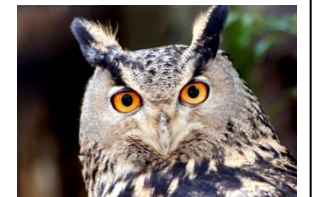
Hibou moyen duc