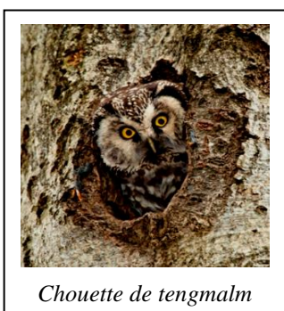
Chouette de tengmalm