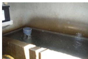
Station de traitement